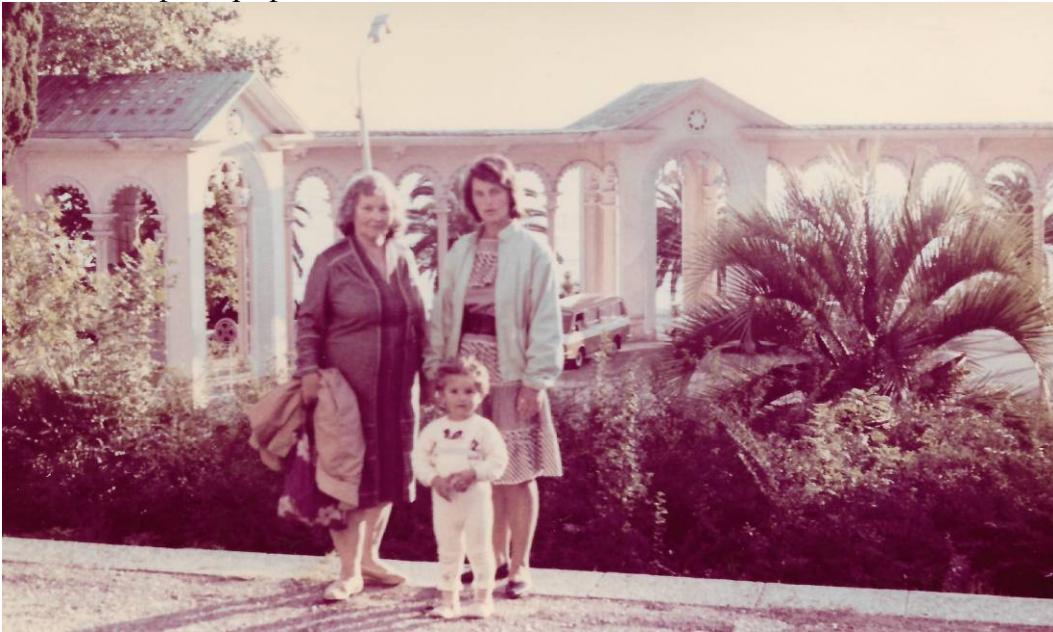
Мать, жена и сын Сахарова Л.Г. в Гаграх 1990 год.