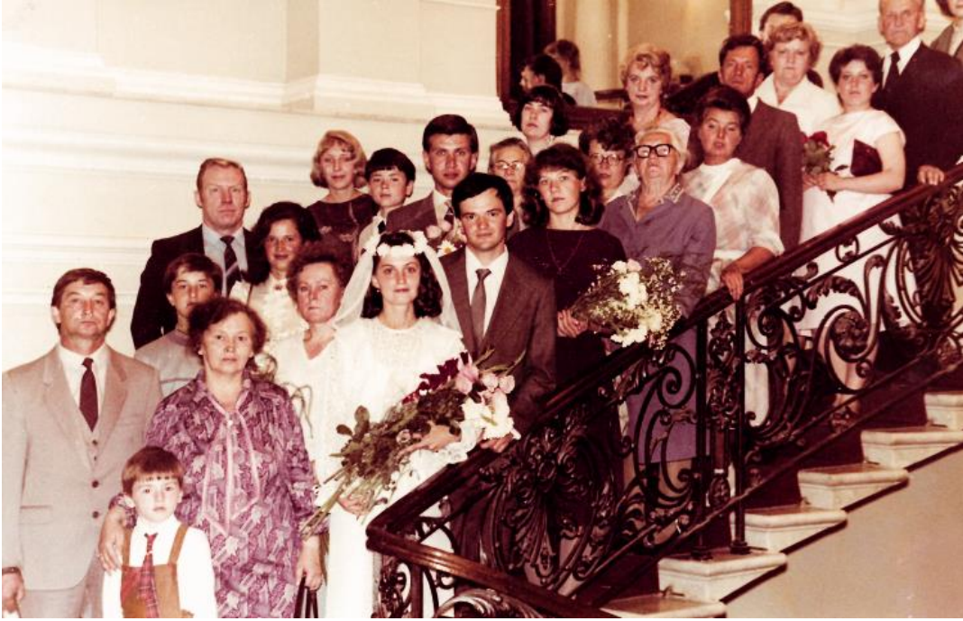
Свадебная фотография. 1986.